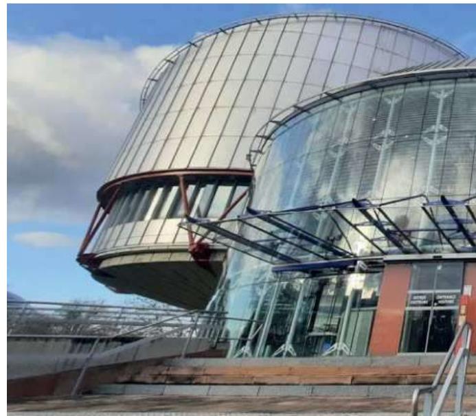
Der Europäische Gerichtshof für Menschenrechte in Straßburg

Gerade im Jahr des 75-jährigen Jubiläums der Europäischen Menschenrechtskonvention (EMRK) ist neuerlich eine Diskussion um die Interpretation der in Österreich im Verfassungsrang stehenden EMRK durch den Europäischen Ge-