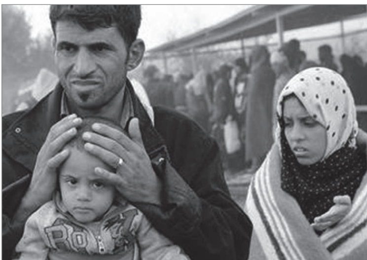
Auch in Tschechien: die Caritas hilft Flüchtlingen

7. Vor dem Gesetz der Scharia erschrecken besonders diejenigen, die lediglich einzelne aus dem Zusammenhang gerissene Sätze aus der Boulevard-Presse kennen. Diese wenigen, aber ständig zitierten Passagen (z. B. über die Tötung von Abtrünnigen und die Unterordnung der Frauen) sind historisch bedingt und die meisten islamischen Länder üben sie nicht aus. Das ist vergleichbar mit der katholischen Kirche, die einige ältere